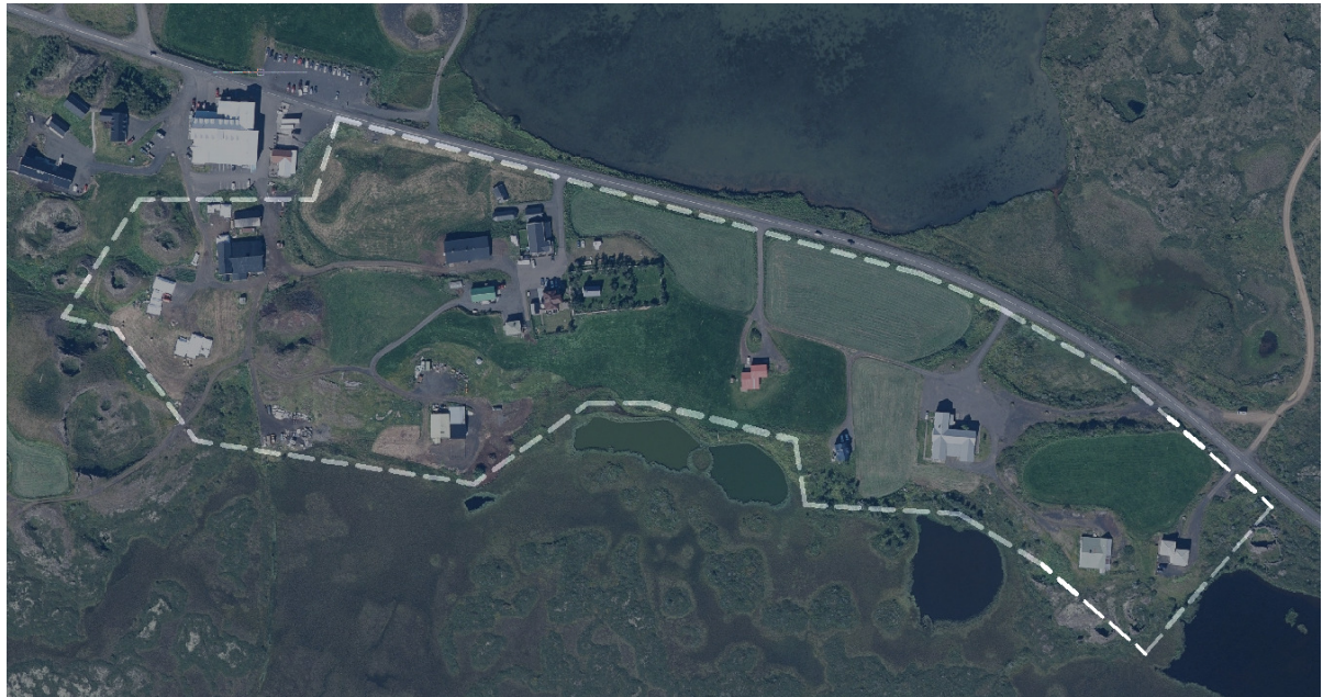
Mynd 1. Afmörkun skipulagssvæðisins.

Skipulagssvæðið er um 11,9 ha að stærð. Að vestan liggja mörk skipulagssvæðisins að eftirfarandi skipulögum; Deiliskipulag í landi Skútustaða II og Sel-Hótel við Mývatn . Að norðan ræður helgunarsvæði þjóðveggar 848, Mývatnsveggar. Fyrir norðan helgunarsvæðis þjóðveggarins er í gildi Deiliskipulag Skútustaðagíga . Að austan liggja skipulagsmörkin að gerfigignum Dagmálaborg en að sunnan liggja mörkin heim að tjörnum þar sem Framengjar byrja.